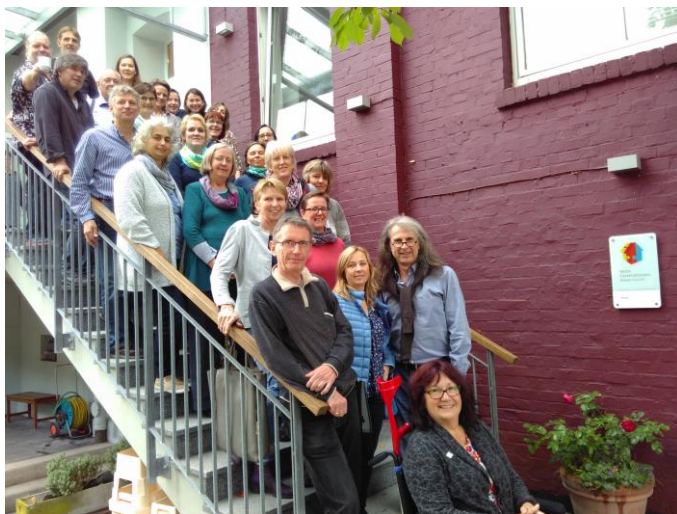
Bundesnetzwerktreffen in Kassel 09/2017

„Die Mehrgenerationenhäuser stellen bundesweit, besonders für den ländlichen Raum, eine unverzichtbare soziale Infrastruktur dar und leisten damit einen wichtigen Beitrag zum generationenübergreifenden Dialog und zur Herstellung gleichwertiger Lebensverhältnisse. Wir wollen sie absichern und weiter ausbauen, insbesondere im ländlichen Raum.“